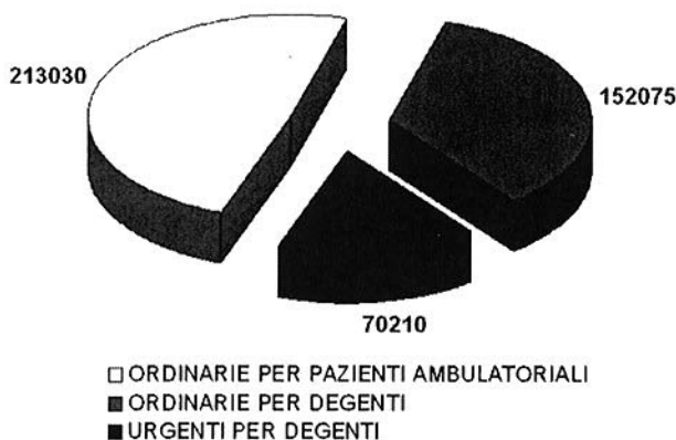
Figura I Stima delle analisi, suddivise per tipo, che saranno richieste al Laboratorio dell'Ospedale Del Ponte in un anno

L'attuale organizzazione del Laboratorio permette di eseguire in modo soddisfacente un numero di analisi ordinarie pari a quello atteso; invece non consente di evadere con la necessaria rapidità l'atteso numero di richieste di analisi urgenti. La vigente organizzazione dei Servizi di Laboratorio degli Ospedali di Varese prevede che, quando il Laboratorio dell'Ospedale Del Ponte non è attivo (giorni festivi e fasce orarie serale e